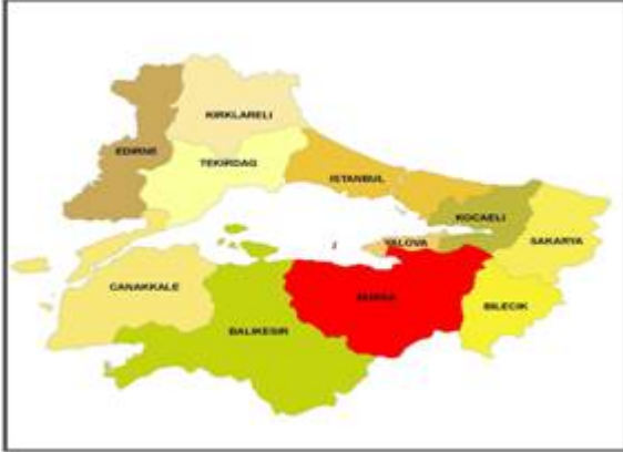
Bursa'nın bölgedeki yeri

Bursa 17 ilçeye sahip bir il merkezidir. Bursa'ya ait ilçeler sırasıyla; Nilüfer, Osmangazi, Yıldırım, Büyükorhan, Gemlik, Gürsu, Harmancık, inegöl, İznik, Karacabey, Keles, Kestel, Mudanya, M. Kemalpaşa Orhaneli, Orhangazi, Yenişehir'dir. Bu ilçelerden Nilüfer, Osmangazi, Yıldırım Büyükşehir Belediyesi'ni oluştururken 5216 sayılı "Büyükşehir yasası" kapsamında Gemlik, Gürsu, Kestel, Mudanya ilçeleri de Büyükşehir Belediyesi sınırlarına dahil olmuştur.